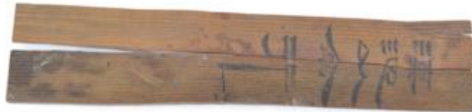
简牍(文字为“滇池以亭行”)